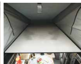
エレベーターグループ