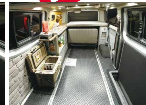
シート収納時 リビングスペース