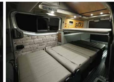
ベッド展開+2段ベッド(就寝時収納スペース)