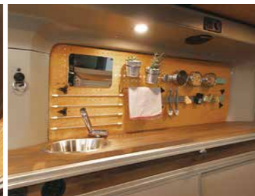
有孔ボード+マグネットバー オプション