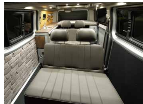
走行時 2列目3列目シート