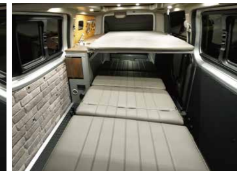
ベッド展開+2段ベッド(就寝時収納スペース)